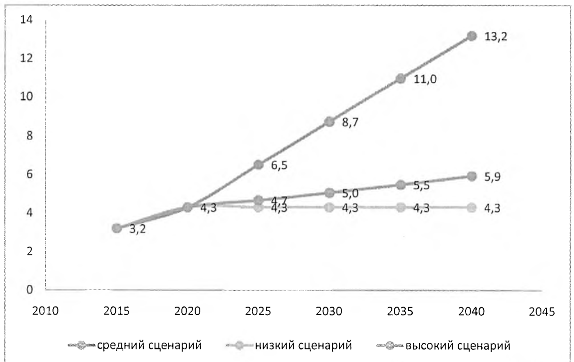
Рис. 2 Прогноз жилищного строительства

• Низкий (инерционный) сценарий – ориентируется на сохранение сложившегося положения на конец 2019 года, как объемов жилищного строительства, так и миграционных потоков движения населения, рождаемости, ожидаемой продолжительности жизни, оставляя данные показатели без изменений.