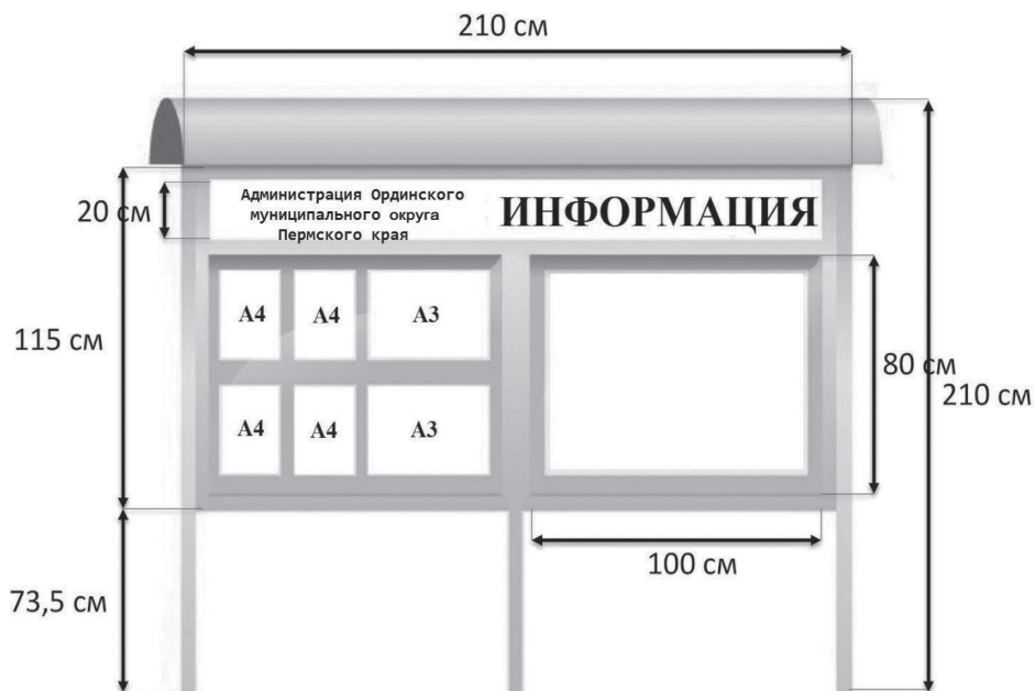
Или вариант №2